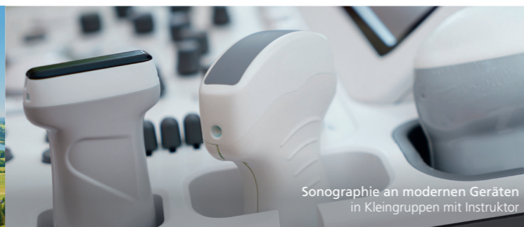
Sonographie an modernen Geräten in Kleingruppen mit Instruktor