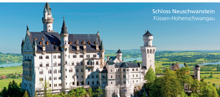
Schloss Neuschwanstein Füssen-Hohenschwangau

Schnittbilddiagnostik gemäß DEGUM und KBV-Richtlinien/LÄK 25 Fortbildungspunkte